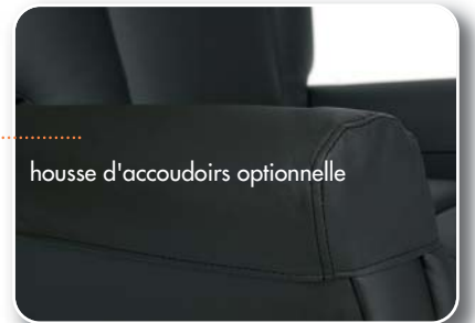
housse d'accoudoirs optionnelle

La version 2 moteurs vous permet d'avoir une indépendance totale entre le dossier et le relève-jambes. Vous pouvez ainsi utiliser le relève-jambes sans incliner le dossier, et vis versa.