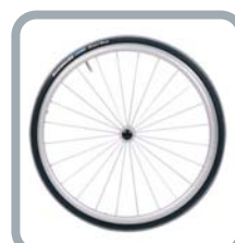
Protection rayons B85 (transparent)