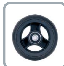
Roues 4" noires