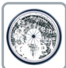
Protection rayons B85 M3 "Extreme"