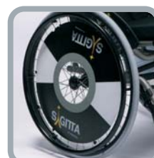
Protection rayons B85 logo Sagitta