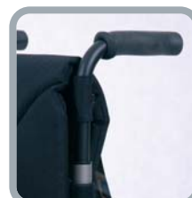
Poignées de poussée standard