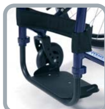
Repose-pieds mono- bloc avec plaque alu