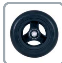
Roues 5" noires