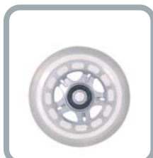
Roues 3" translucides