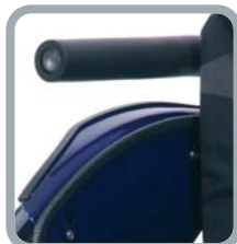
Protège-vêtements B82S + tube