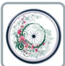
Protection rayons B85 M1 "Fleurs"