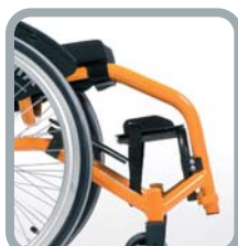
Repose-pieds avec plaque alu (enfant)