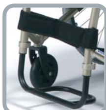
Repose-pieds mono- bloc tube standard