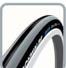
Schwalbe Right Run