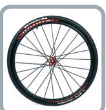
Roues 24" Viking