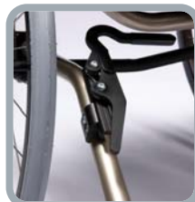
Freins sport (freins ciseaux)