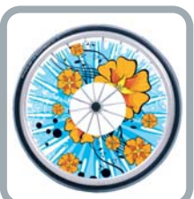
Protection rayons B85 M2 "Fleurs"