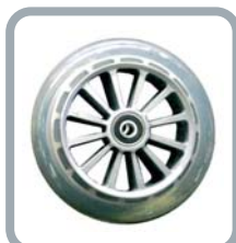
Roues 5" translucides