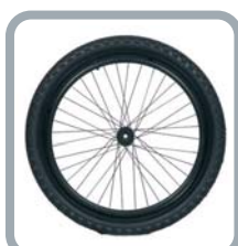
Roues 24" Off Road