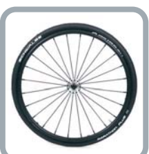
Roues 24" Spinergy