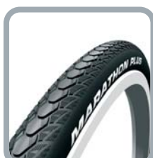
Schwalbe Marathon Plus Evolution