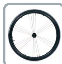
Roues 24" Exclusive