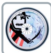
Protection rayons B85 M3 "Pirate"