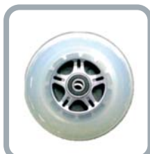
Roues 4" translucides