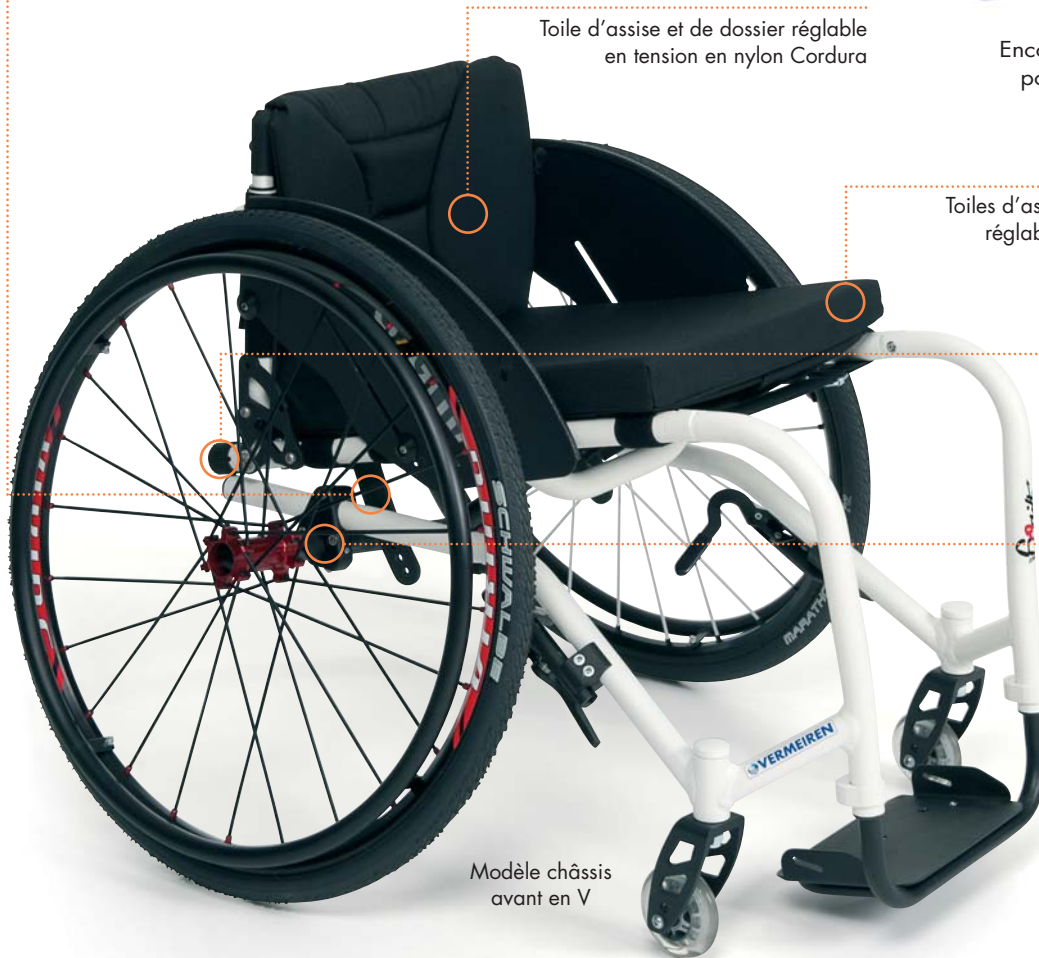
Toile d'assise et de dossier réglable en tension en nylon Cordura

NOUVEAU : option assise inclinable 6° - 14°