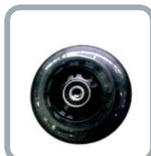
Roues 3" noires