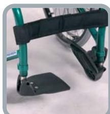
Repose-pieds palettes séparées