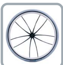
Roues 24" Spider