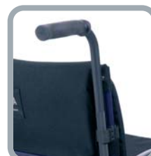
Poignées de poussé réglables en hauteur