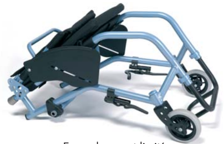
Encombrement limité pour le transport

NOUVEAU : option assise inclinable 6° - 14°