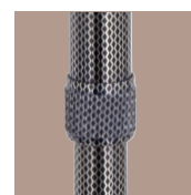
Bague serrage antibruit