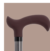
Poignée soft touch

Conditionnement : Cartons : 12 - Palette : 600