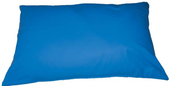
410164 micro billes 410187 fibres

fibres : fibres creuses enduites de silicone légère et souple.