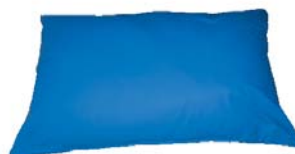
410162 micro billes 410183 fibres