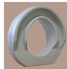
Fixation sans vis ni outils