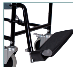
Repose pieds amovibles et rétractables