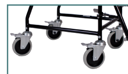
4 roulettes avec freins